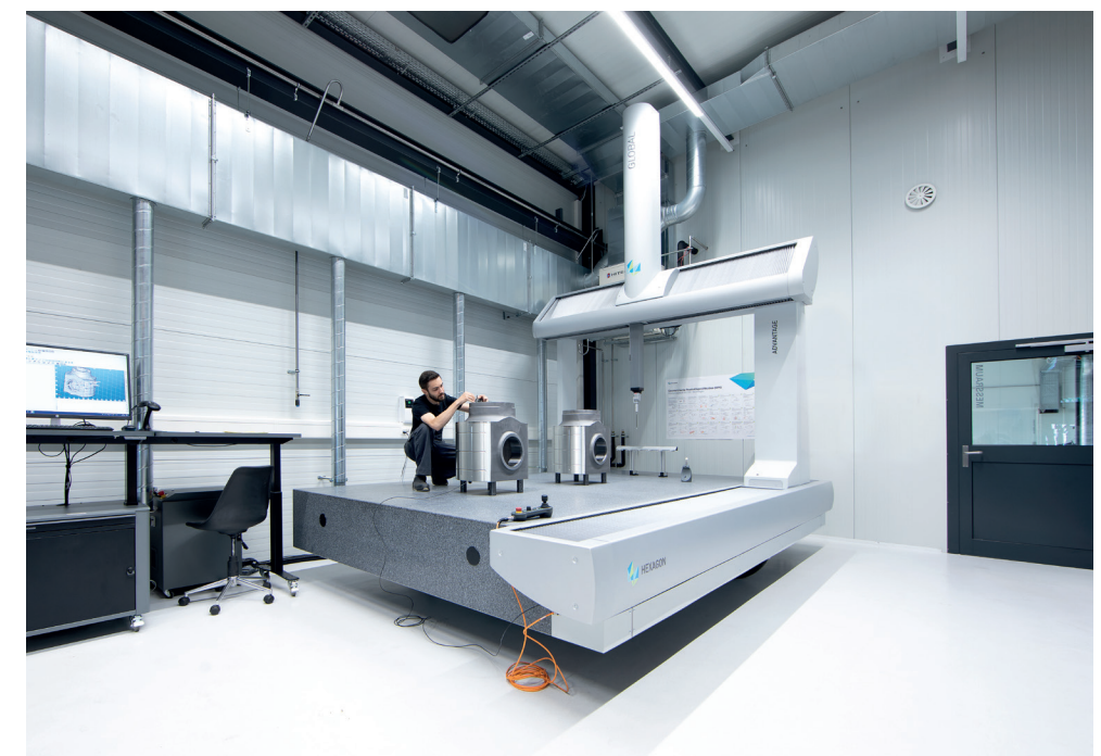
Klimatisierter Messraum bei 20 \pm 0.5 °C, Güteklasse 3 nach VDI / VDE 2627